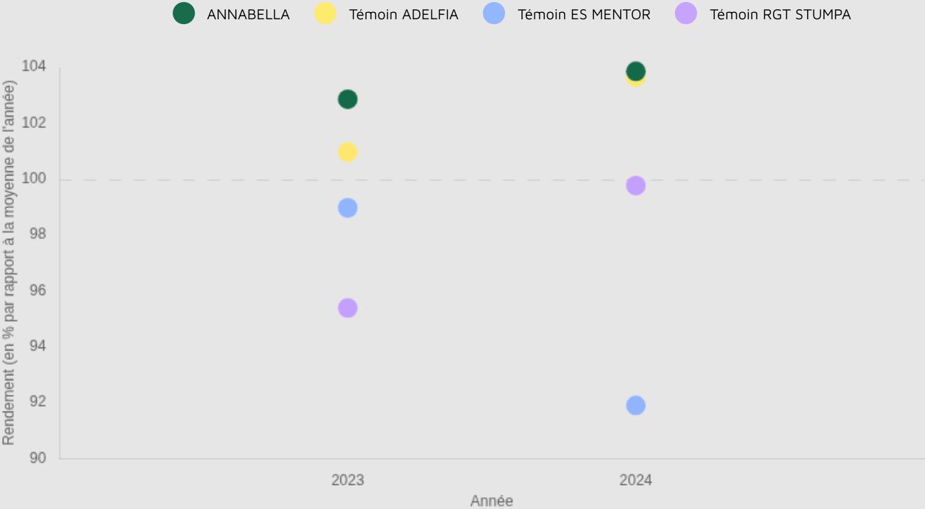
Graphique d'indice de rendement

39.2 q/ha Rendement estimé 2024 103.9 % Indice de rendement 2024