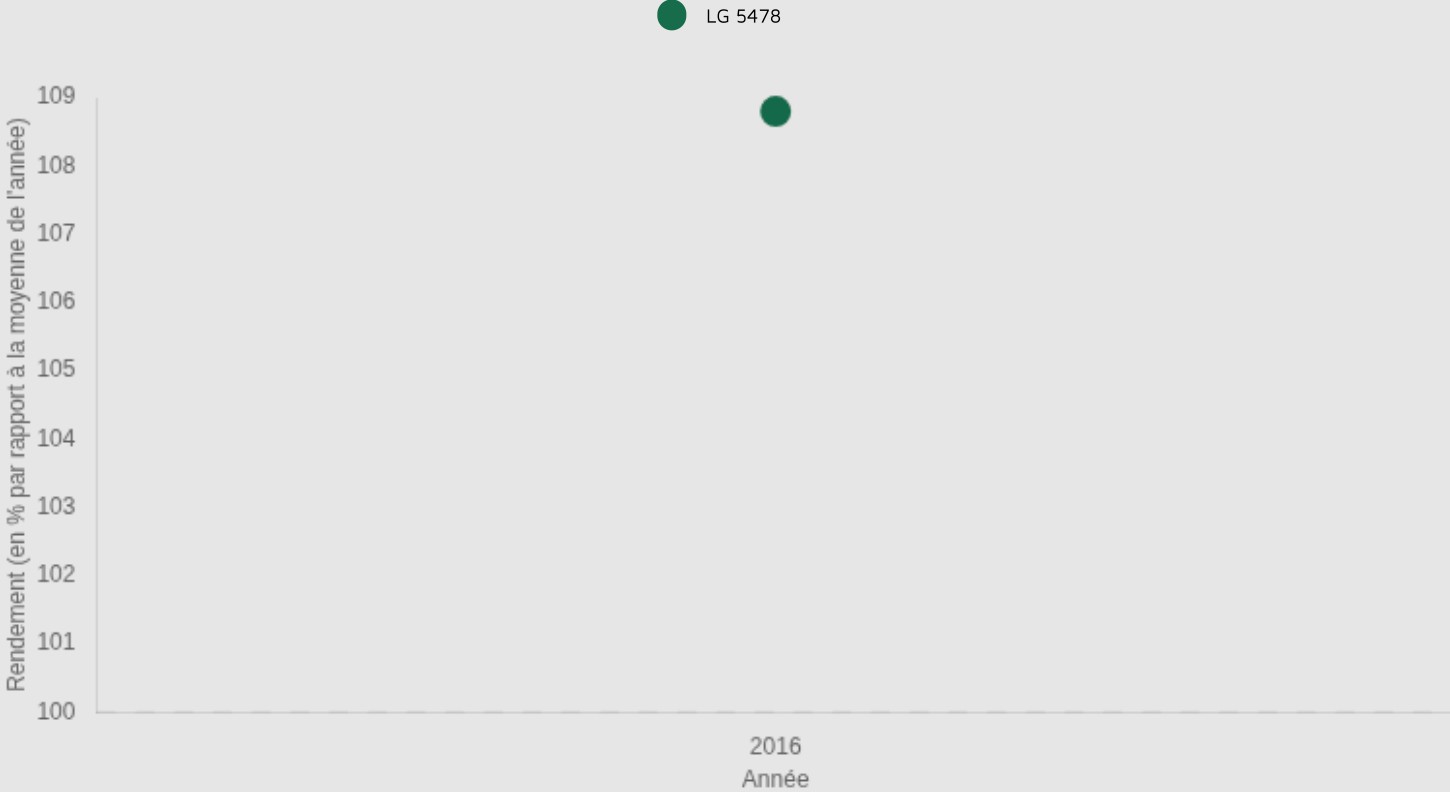
Graphique d'indice de rendement