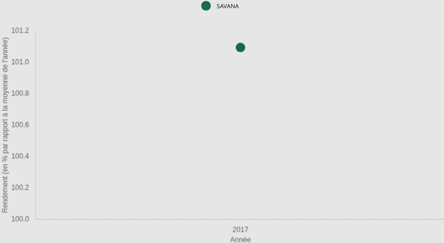
Graphique d'indice de rendement