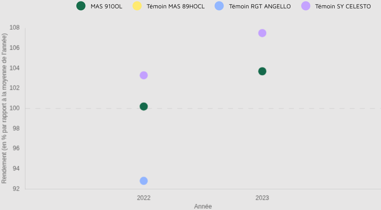
Graphique d'indice de rendement