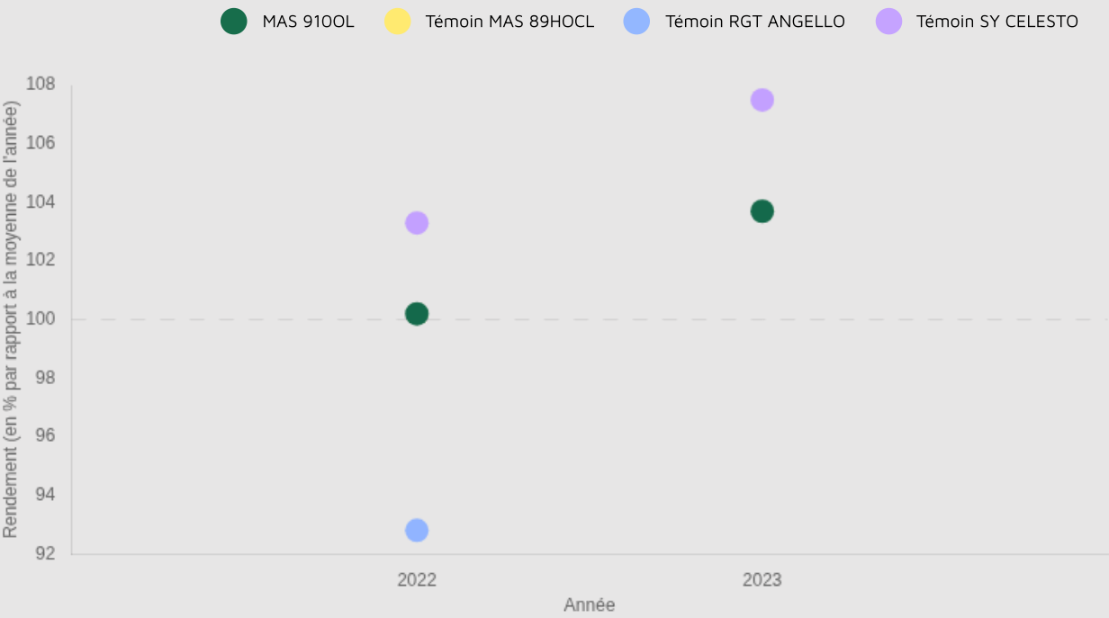
Graphique d'indice de rendement

NaN q/ha Rendement estimé undefined NaN % Indice de rendement undefined